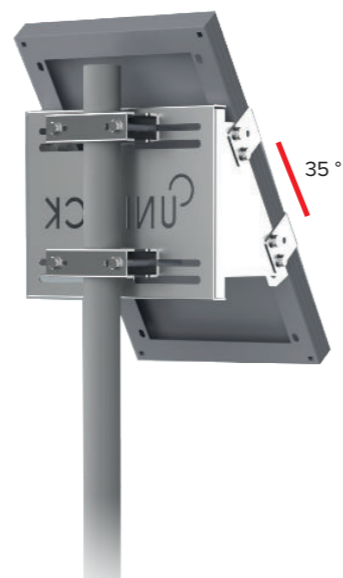
UNIFIX 20SF Pour Unisun 10.12M/ 10.24M/ 20.12M/ 20.24M Orientation portrait Tête et milieu de mât Brides de fixation en option Ref 1139