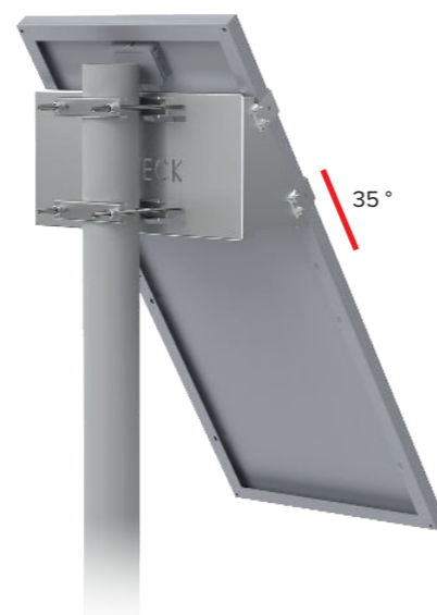
UNIFIX 100SF Pour Unisun 80.12M/ 100.12M/ 100.24M/ 120.12BC Orientation portrait Tête de mât Brides de fixation en option Ref 1146