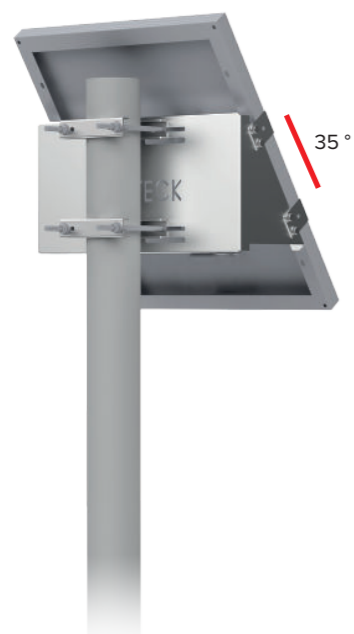
UNIFIX 50SF Pour Unisun 30.12M/ 50.12M/ 50.24M/ 55.12BC Orientation portrait Tête et milieu de mât Brides de fixation en option Ref 0064