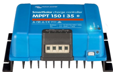
Contrôleur de charge SmartSolar MPPT 150/35