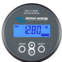
Détection Bluetooth BMV-712 Smart Battery Monitor