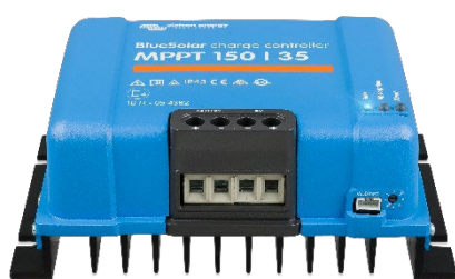
Contrôleur de charge solaire MPPT 150/35