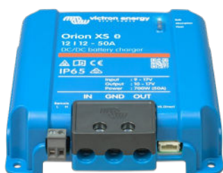
Zone de connexion du chargeur de batterie CC-CC Orion XS 12/12-50 A WiFi