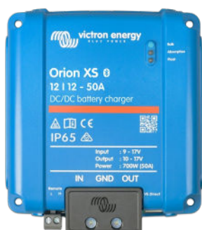
Chargeur de batterie CC-CC Orion XS 12/12-50 A