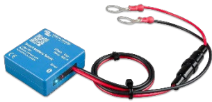
Smart Battery Sense Permet d'activer la charge à compensation de tension et de température.