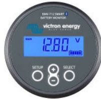
Contrôleur de batterie BMV-712 Smart