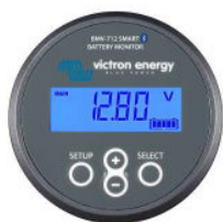
Détection Bluetooth BMV-712 Smart Battery Monitor