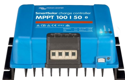
Contrôleur de charge SmartSolar MPPT 100/50