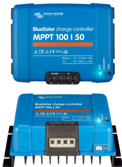
Contrôleur de charge solaire MPPT 100/50