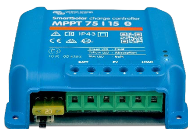
Contrôleur de charge SmartSolar MPPT 75/15