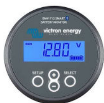
Détection Bluetooth BMW-712 Smart Battery Monitor