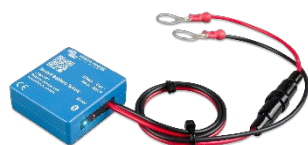
Détection Bluetooth Smart Battery Sense