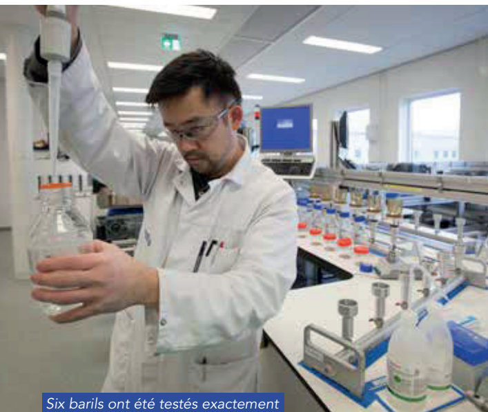
Six barils ont été testés exactement de la même manière.