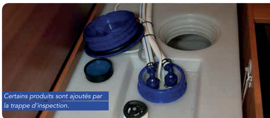
Certains produits sont ajoutés par la trappe d'inspection.