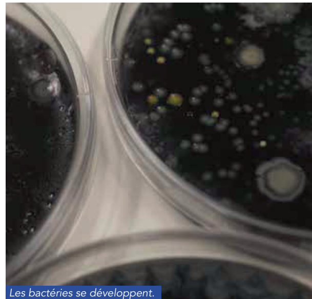
Les bactéries se développent.